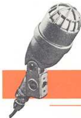
Type EL 6020

Electro-dynamische microfoon, zeer gevoelig aan één zijde, heldere weergave van gesproken woord. 3 impedanties. Voorzien van klikvrije kortsluitschakelaar, welke kan worden veranderd in een onderbrekingschakelaar. Met 5 meter kabel en aansluitpluggen.