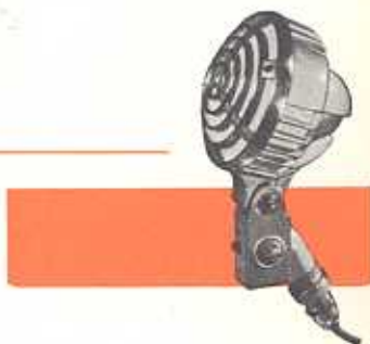
Type EL 6040

Electro-dynamische cardioïde-microfoon met zeer sterk richteffect en twee gevoeligheidsminima aan de achterzijde. Speciaal bestemd voor plaatsen waar omgevingsruis aanwezig is of waar gevaar voor acoustische terugkoppeling bestaat. Voorzien van instelscharnier met klemschroef en klikvrije kortsluitschakelaar, welke kan worden veranderd in een onderbrekingschakelaar. 3 impedanties. Met 5 meter kabel en aansluitpluggen.