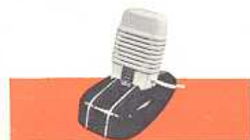
Type EL 6000

Electro-dynamische microfoon (handmodel); een uitstekende microfoon voor het geven van reportages en commando's. Voorzien van kabel en aansluitplug.