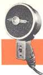
Type EL 6010

Electro-dynamische microfoon, zeer gevoelig aan één zijde, heldere weergave van gesproken woord. 3 impedanties. Voorzien van klikvrije kortsluitschakelaar, welke kan worden veranderd in een onderbrekingschakelaar. Met 5 meter kabel en aansluitpluggen.